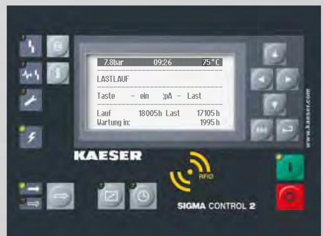
Abb.: SIGMA CONTROL 2

Übernahmetaste – löst Sprung in nachstehendes Untermenü oder übernimmt Werte.